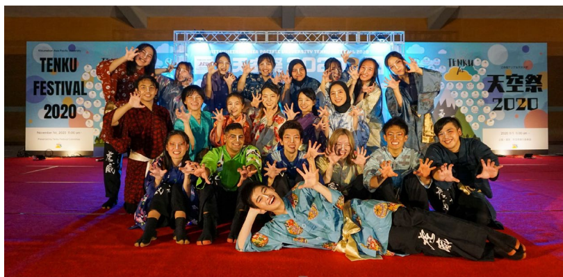
*写真は2020年の天空祭（オンライン開催）の様子です

概要：APUの文化祭「天空祭」は、数多くの国・地域からの学生が集うAPUキャンパスの多文化・多国籍な環境を、地域の方々に体験していただくことによる相互理解と地域振興を目的として実施しています。当日は学生によるパフォーマンス、模擬店などが実施される予定です。約3年ぶりの対面開催となる今年の「天空祭」は、ほとんどの学生にとって初めての体験となります。詳細は後日、プレスリリースにて別途ご案内いたします。